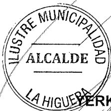
YERKO HERNALDO GALLEGUILLO OSSANDON ALCALDE ILUSTRE MUNICIPALIDAD DE HIGUERA