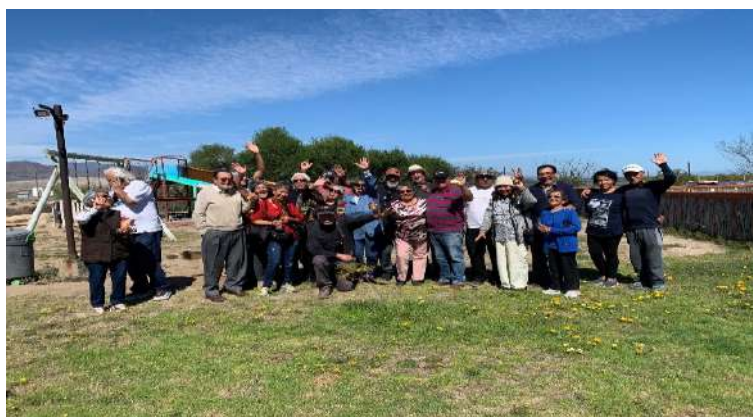
Constitución "Agrupación de mujeres Emprendedoras de La Higuera, 29 de mayo de 2023