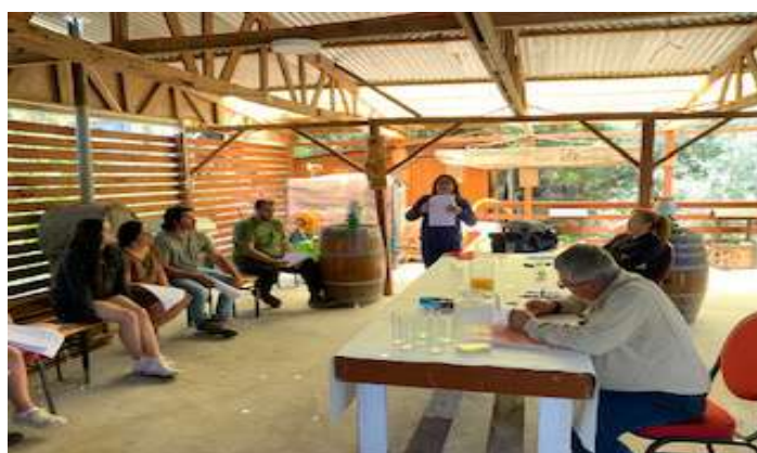
Comité de Emergencia Trapiche Verde