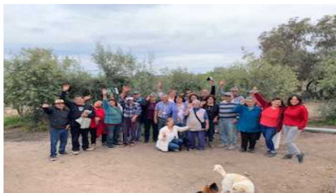
Constitución Comité de Adelanto El Olivo, 09 de septiembre de 2023