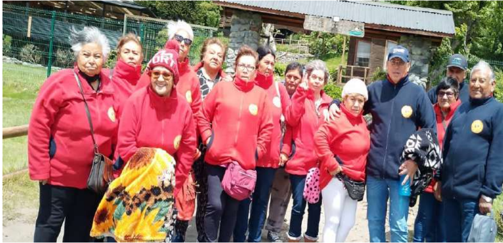
Operativo dental, que beneficio a los Adultos Mayores de Punta Colorada.