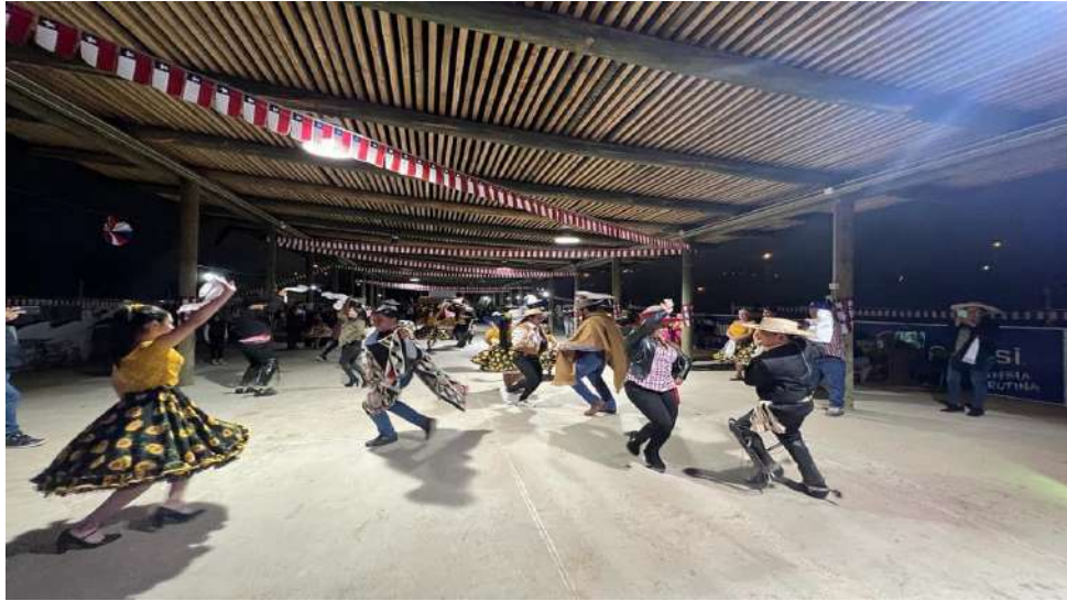
Feria Costumbrista 2023 organizada por JJVV de La Higuera y municipio