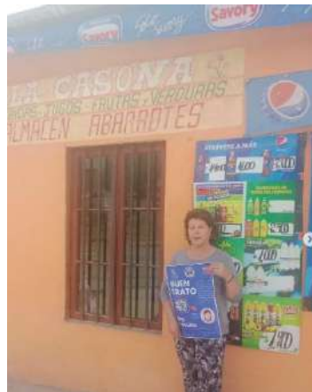
20 de febrero difusión de BUEN TRATO en negocios locales