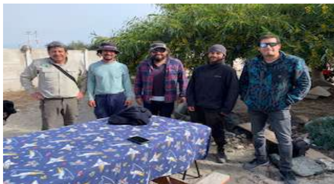
Constitución Agrupación Social, Cultural y Medioambiental Territorio Chango, 24 de julio de 2023