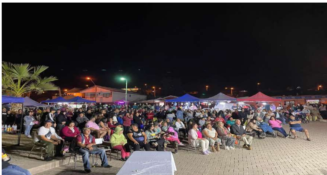
Fiesta del Loco 2023, Caleta Los Hornos