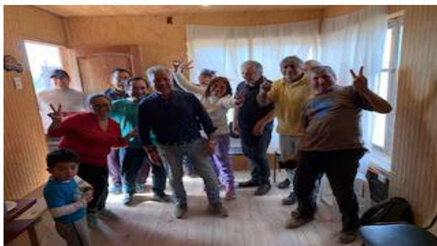
Constitución Comité de Administración Santa Esperanza, Llano Los Choros