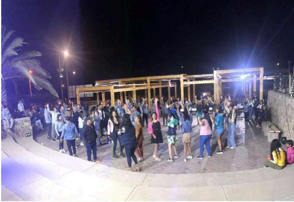
Tributo a Sosa Stereo con banda nacional Gracias Totales