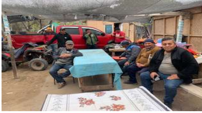
Club Social y Deportivo de Rayuela y Dominó Fernando Vergara