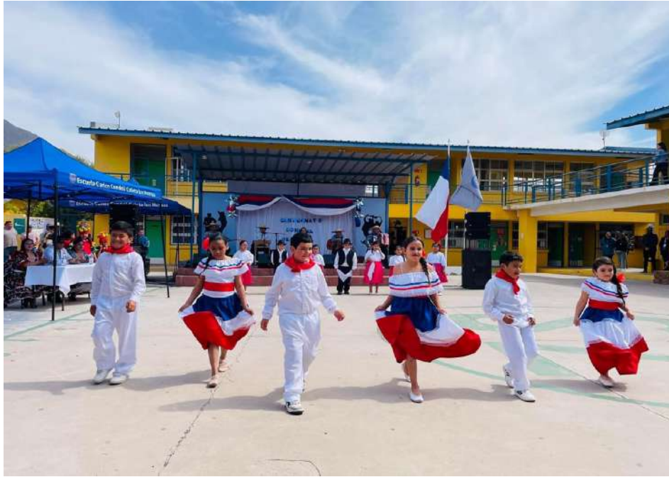
Acto central y desfile cívico de aniversario comunal 132 de La Higuera