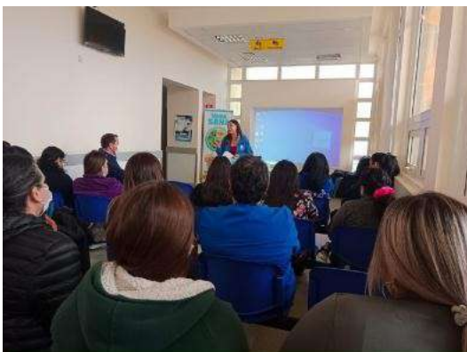
03 de marzo. Activación en CESFAM La Higuera, entregando información a funcionarios/as en torno al Enfoque de Derechos de NNAs.