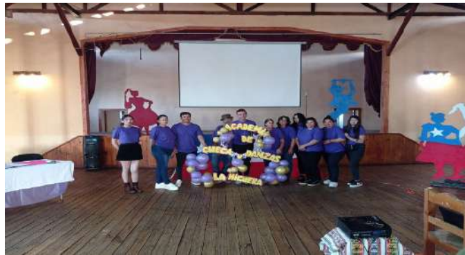
Constitución Academia de Cueca y Danzas La Higuera, pasión y tradición Cultural, 13 de diciembre de 2023