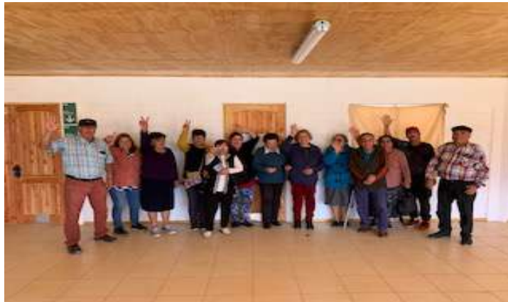
Club Adulto Mayor Jerusalem, Caleta Los Hornos