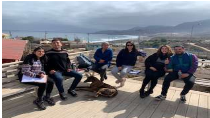
Organización Movimiento Ambiental Camanchaca