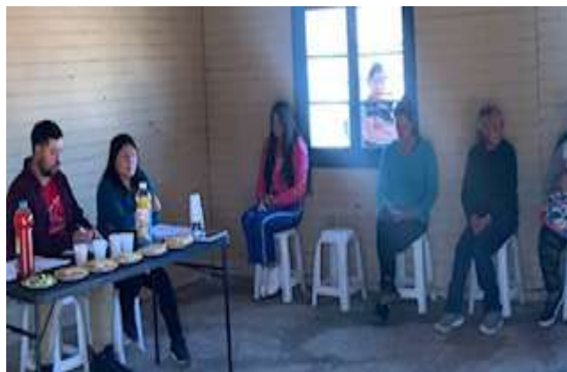
Junta de vecinos N | 17 Villa Pajaritos