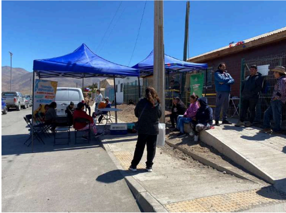
Operativo de esterilización realizado en Punta Colorada, el día 05 de octubre 2023, en el cual se realizaron 39 cirugías. Operativo que permite la asistencia de personas del sector rural, específicamente crianceros.