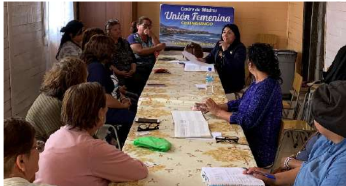
Centro de Madres Unión Femenina de Chungungo