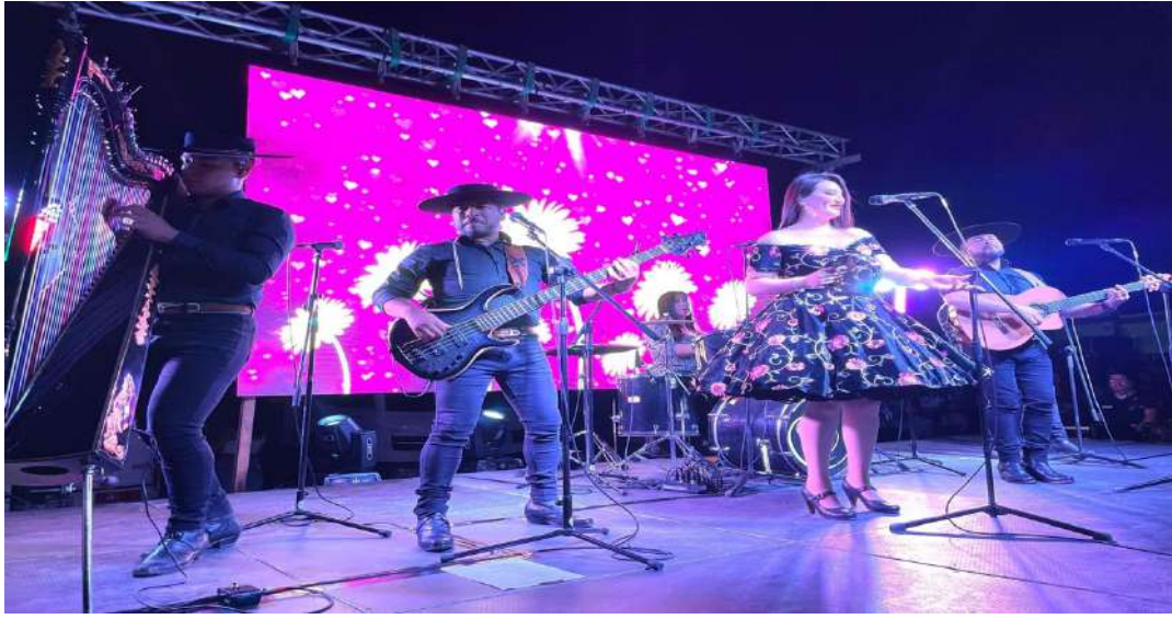
Festival de Festivales, La Higuera