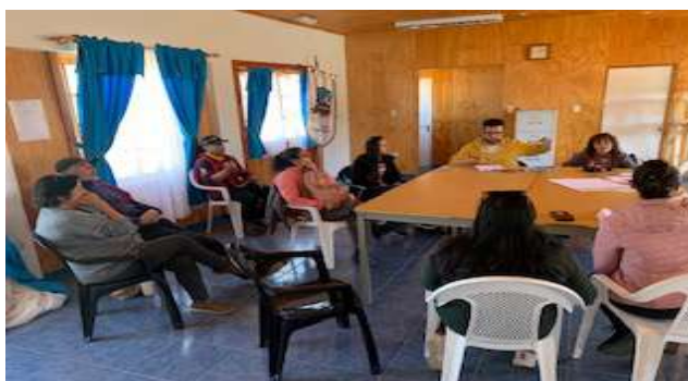
Constitución Agrupación Artesanal, Cultural y Turística de Emprendedores de Los Choros, 17 de agosto de 2023