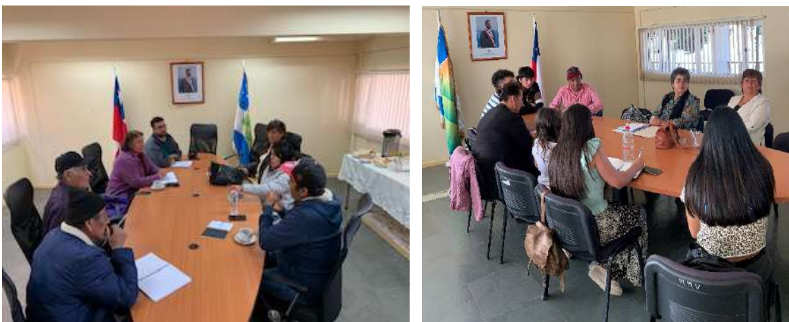
Mesa comunal de Desarrollo Rural 2023