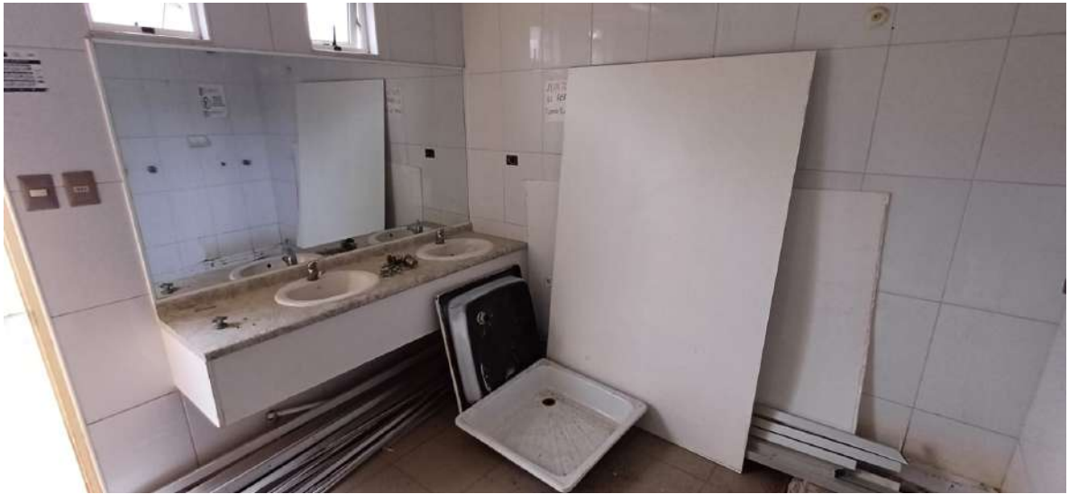
Lugar previo a la modificación.