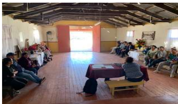
Constitución Baile Religioso Indios Changos de San Agustín, Punta de Choros