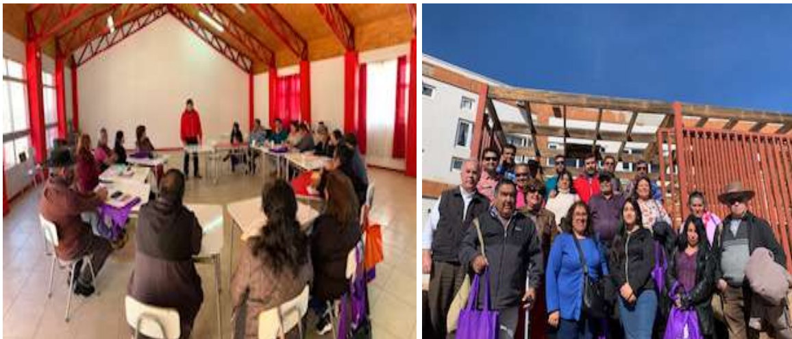
Primera Mesa Provincial de Desarrollo Rural, realizada en agosto de 2023 en la comuna de La Higuera.