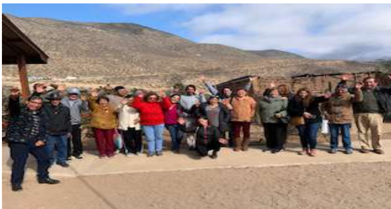
Constitución "Olivas Valle Escondido", 25 de abril de 2023