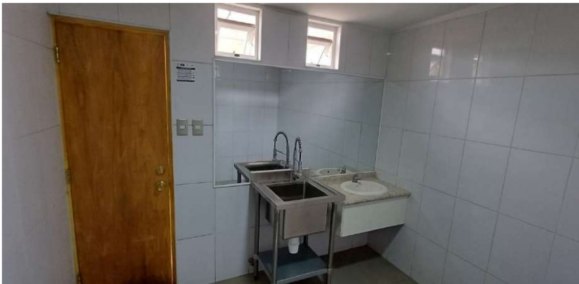
Interior de la consulta veterinaria, en espera de mobiliario para su equipamiento final.