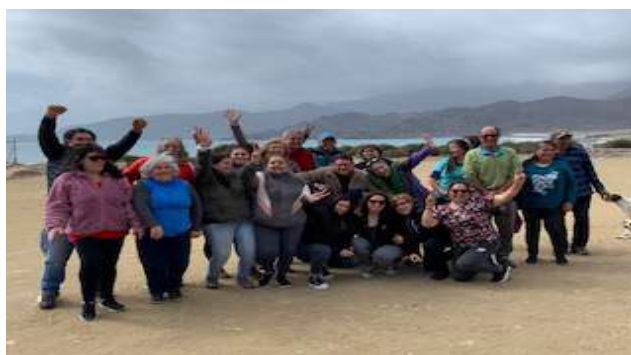
Constitución Club Adulto Mayor Amancay de Totoralillo Norte, 12 de agosto de 2023