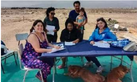
16 de febrero reunión con junta de vecino de localidad El Llano Los Choros

El componente comunitario del programa OPD realiza acciones tanto de promoción y difusión de los derechos de los NNA entre las cuales se encuentran las siguientes acciones: