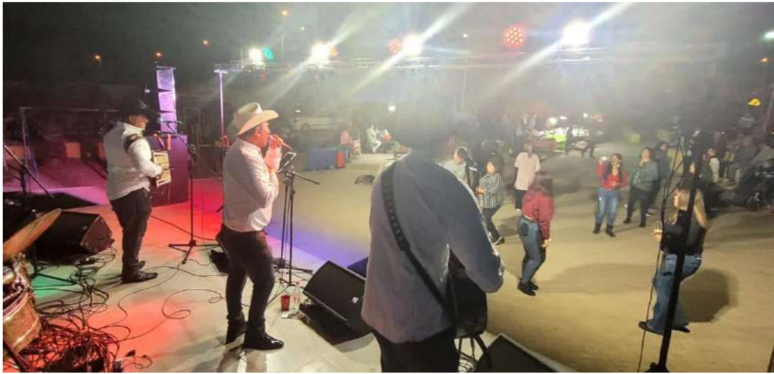
Fiesta del Loco 2023, Totoralillo Norte