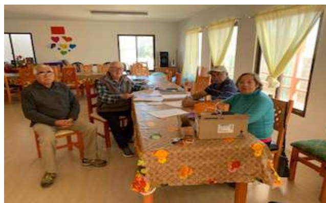
Centro Cultural Chungungo