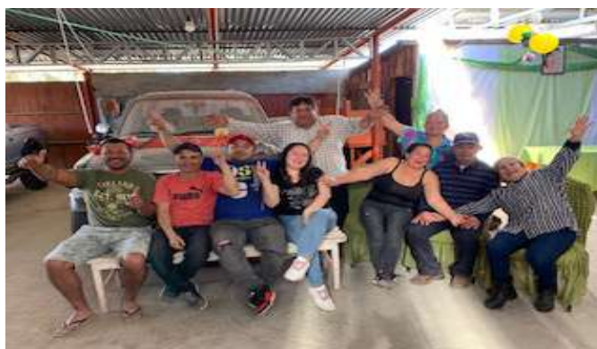
Constitución Agrupación Cultural, Social, y Tradiciones Chilenas de Punta Colorada, 23 de octubre de 2023