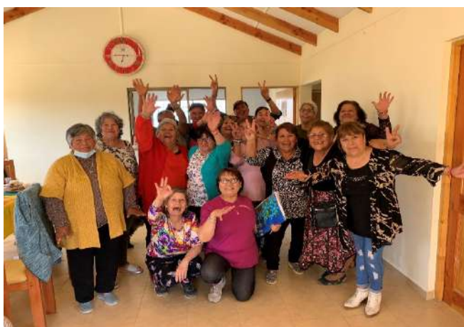
Club Adulto Mayor Futuro Feliz de Punta de Choros